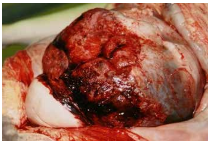
Fig. 1. Trhlina tela maternice a plodové vajce v brušnej dutine.

Autor práce prehlasuje, že v súvislosti s témou, vznikom a publikáciou tohto článku nie je v konflikte záujmov a vznik ani publikácia článku neboli podporené žiadnou farmaceutickou firmou. Toto prehlásenie sa týka i všetkých spoluautorov.